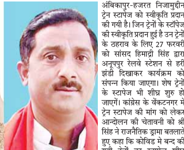
निगौरा, वेंकटनगर में सभी ट्रेनों के स्टॉपेज अतिशीघ्र