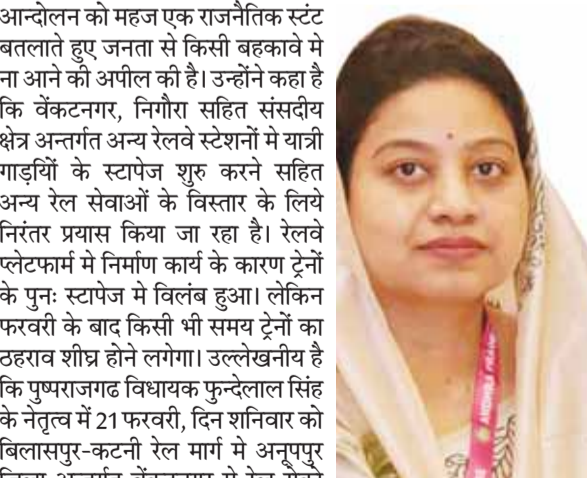
निगौरा, वेंकटनगर में सभी ट्रेनों के स्टॉपेज अतिशीघ्र