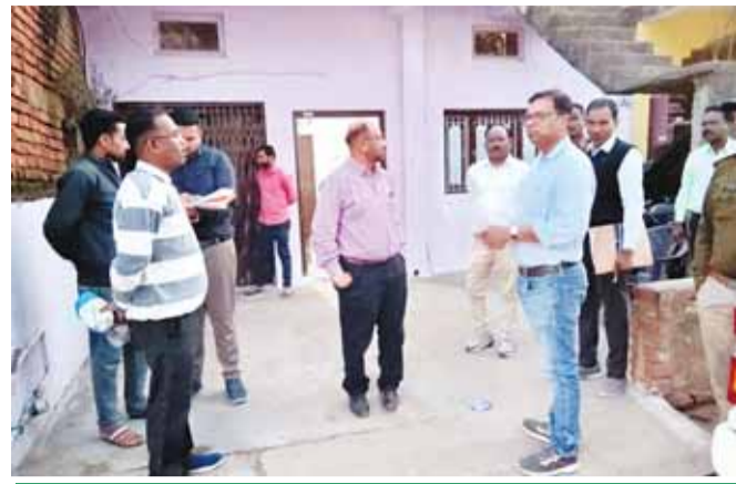
12वीं पास लगा रहा था इंजेक्शन, कानून क्यों खामोश?