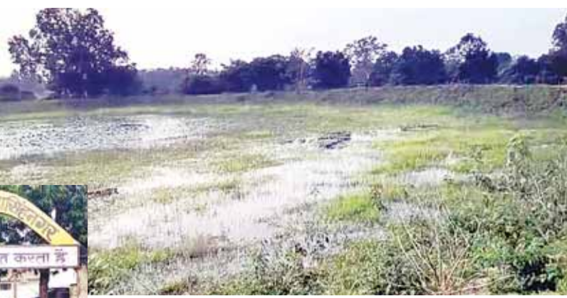
56.90 लाख की भारी रकम से किया जाना था उन्नयन का कार्य